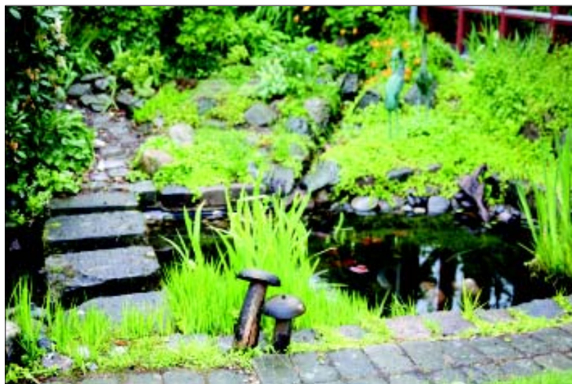
Regnvand fra taget kan bruges til at anlægge en smuk have.