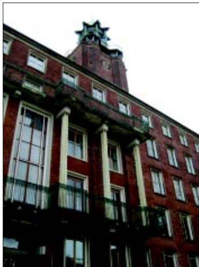
Dette års repræsentantskabsmøde i R98 var henlagt til Frederiksberg Rådhus