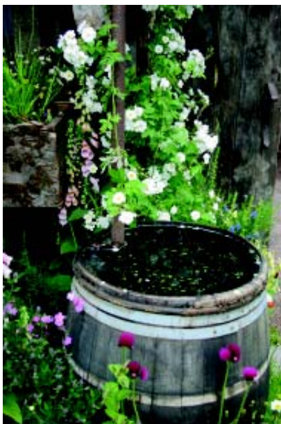
Regnvandet kan opsamles i regnvandstønde inden det ledes i faskine.

Du skal lave faskinen efter anvisninger fra en autoriseret kloakmester. Du kan selv grave hullet til faskinen og købe plastikkassetterne til faskinen i et byggemarked, eller du kan betale en kloakmester for at anlægge faskinen.